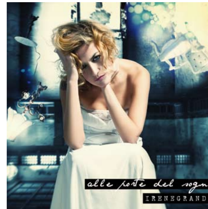
alle porte del sogno IRENEGRANDI

"HO FATTO ERRORI E COLPI DI TESTA, MA HO SEMPRE LASCIATO LIBERA LA MIA CREATIVITÀ. NON MI SONO MAI MESSA A TAVOLINO PER RAGGIUNGERE IL SUCCESSO. HO CONTINUATO A FARE MUSICA E A SPERIMENTARE. E LA GENTE MI HA SEGUITO"