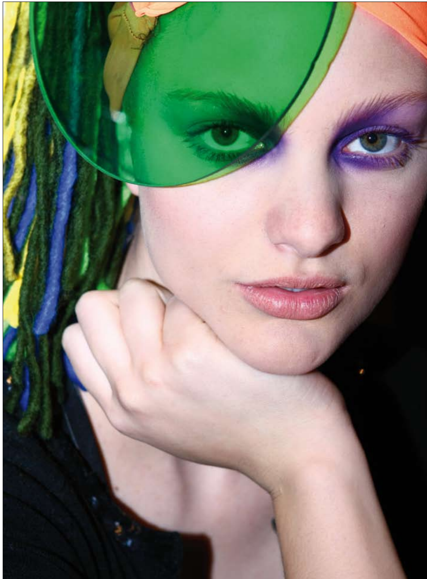
IL CAPPELLO CI COLORA