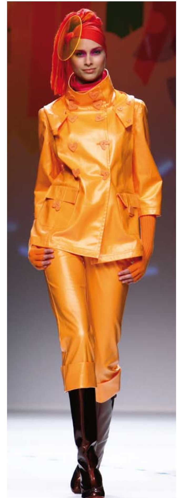
LA MODA ABBRACCIA I COLORI